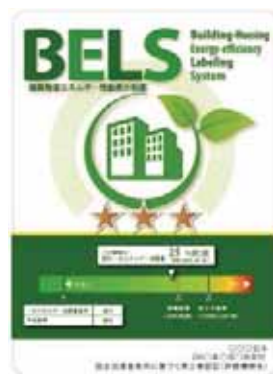
〔図1〕 ガイドラインに基づく第三者認証の例

また、ダイヤモンドリスponsに対応した時間帯別・季節別の電気料金メニューが選択できる場合はその活用に努めるとともに、エネルギー管理システム（BEMS・HEMS等）の導入により、ビルの運用方法、住宅の住まい方の改善によるピーク対策及び省エネルギーに努めること。